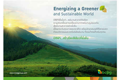
( https://www.bcpgroup.com/th/home )