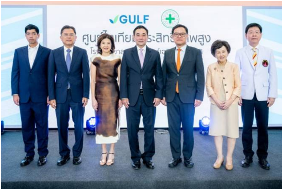
กอล์ฟ เปิด "ศูนย์ไตเทียมประสิทธิภาพสูง"รพ.ธรรมศาสตร์ฯ

กอล์ฟ เปิด "ศูนย์ไตเทียมประสิทธิภาพสูง" รพ.ธรรมศาสตร์เฉลิมพระเกียรติเพิ่มศักยภาพในการดูแลผู้ป่วย พร้อมระบบเชื่อมต่อฐานข้อมูล ต่อยอดงานวิจัย