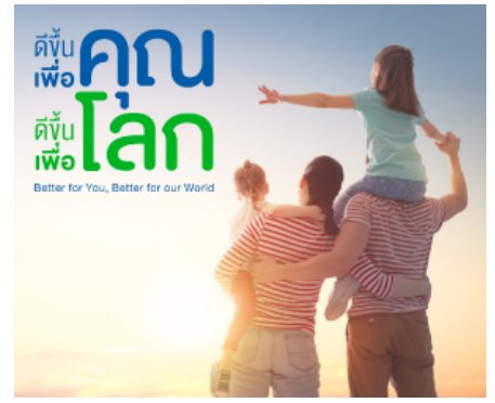
( https://www.pttggroup.com/th/home )